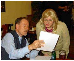
7 Jahre TextLabor Bergedorf - eine ganz besondere offene... von Charlene Wolff