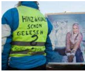
SIE kommt etwas später - aber sie KOMMT !! von Erich Heeder