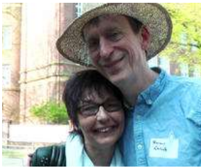
\\ Termin 1. Mai /// Infotreffen Hilfe für Hamburger... von Max Bryan