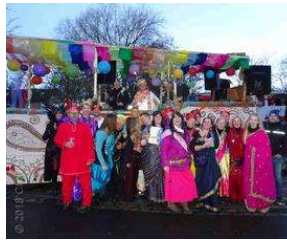
Bergedorferin freut sich königlich beim Marneval von Charlene Wolff